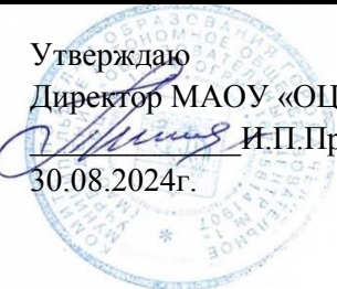
График оценочных процедур на 2024/2025 учебный год