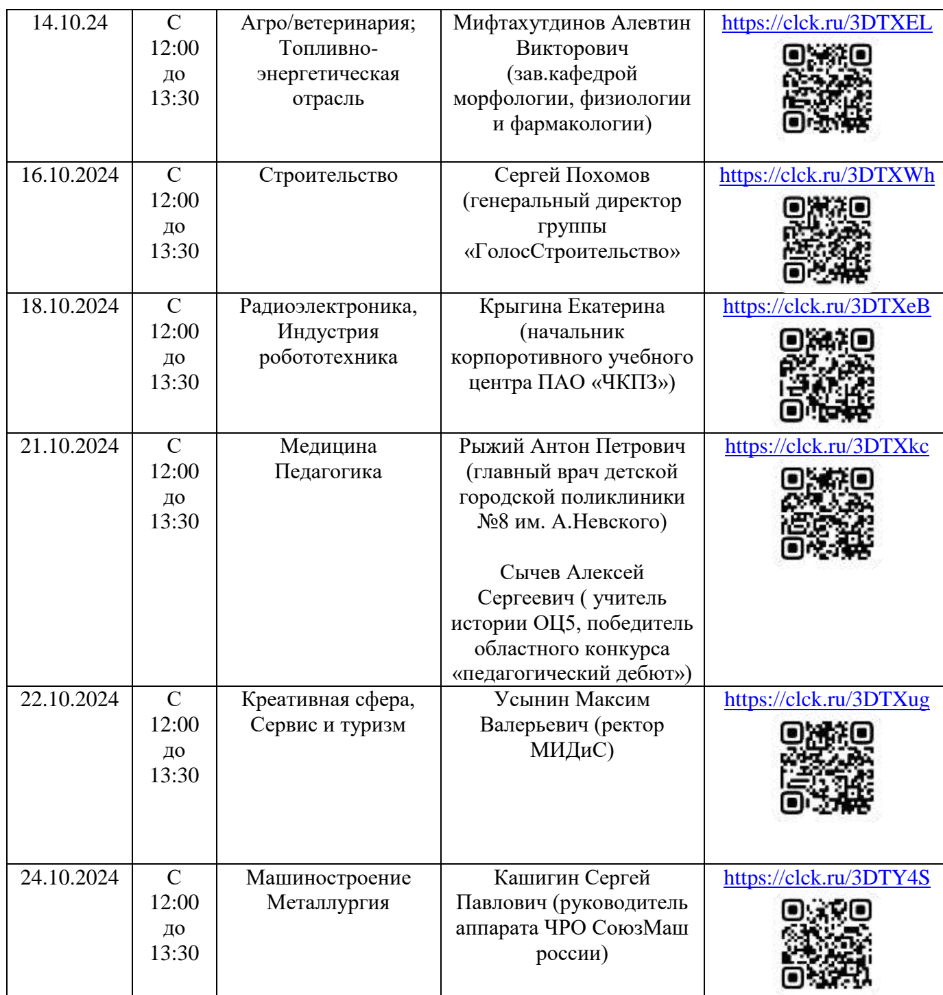
График посещения лектория «Генеральные встречи» с представителями крупных предприятий города Челябинска для 8-11 классов